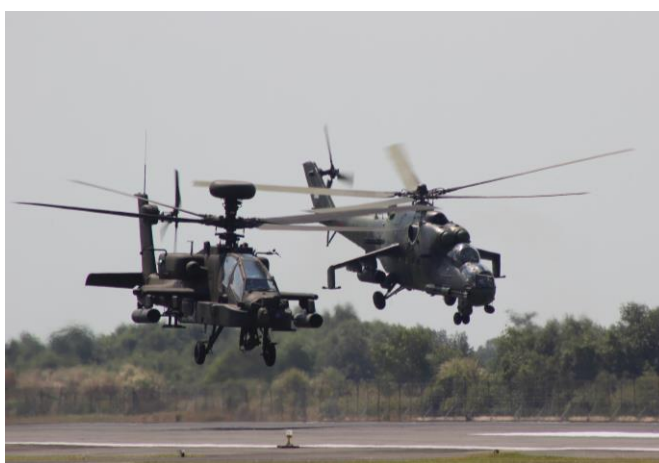
Un hélicoptère AH-64E Apache américain décolle avec un Mi-35 de l'armée indonésienne (TNI-AD) pendant les exercices conjoints Garuda Shield 2014. L'Indonésie a récemment acheté aux États-Unis 8 AH-64E Apache. (Crédit photo: U.S. Army photo courtesy of 25 th Combat Aviation Brigade).